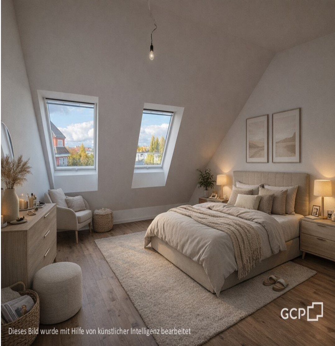
Dieses Bild wurde mit Hilfe von künstlicher Intelligenz bearbeitet