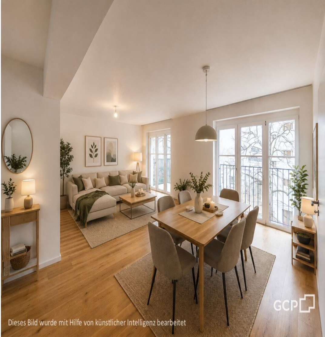
Dieses Bild wurde mit Hilfe von künstlicher Intelligenz bearbeitet