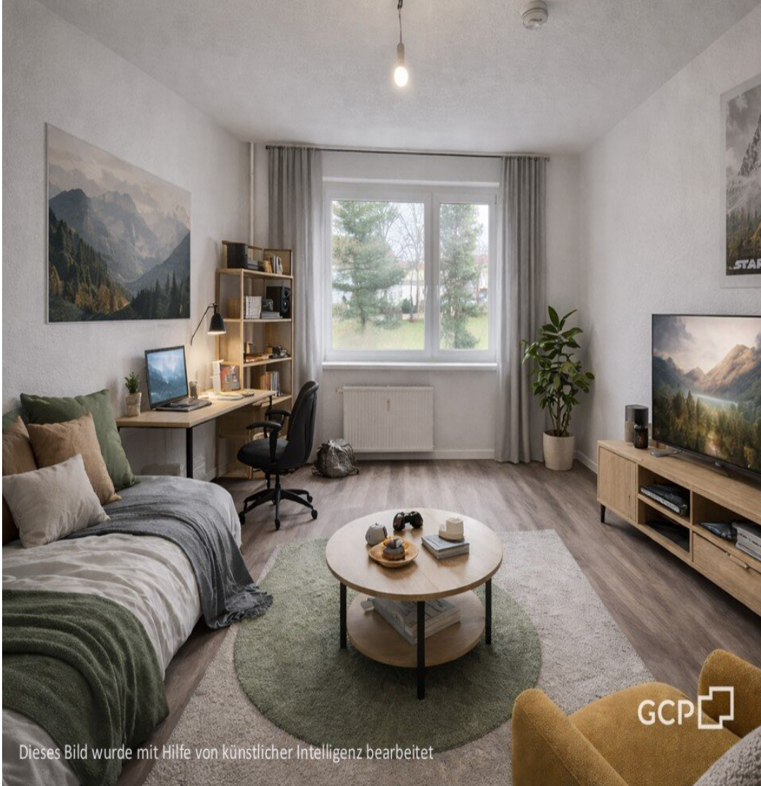
Dieses Bild wurde mit Hilfe von künstlicher Intelligenz bearbeitet