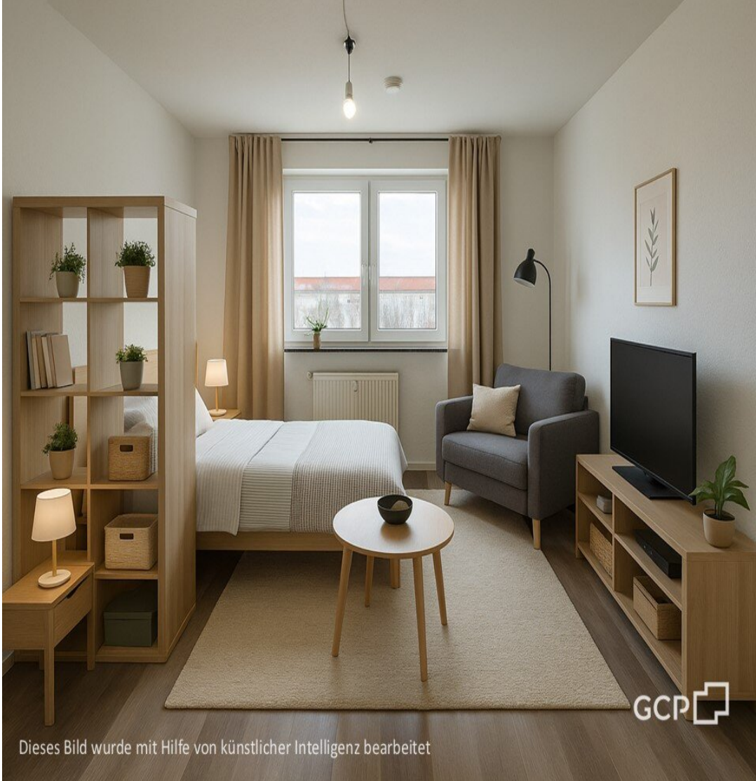
Dieses Bild wurde mit Hilfe von künstlicher Intelligenz bearbeitet