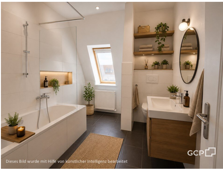
Dieses Bild wurde mit Hilfe von künstlicher Intelligenz bearbeitet