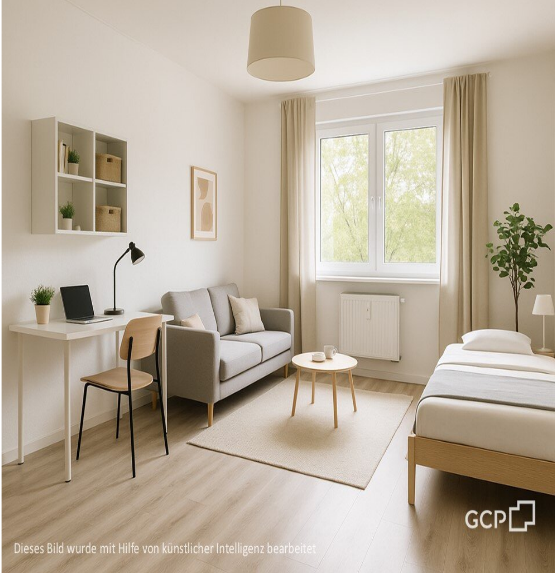
Dieses Bild wurde mit Hilfe von künstlicher Intelligenz bearbeitet