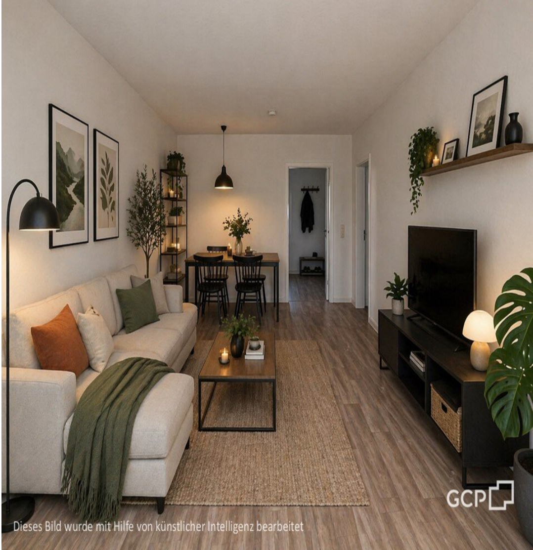
Dieses Bild wurde mit Hilfe von künstlicher Intelligenz bearbeitet