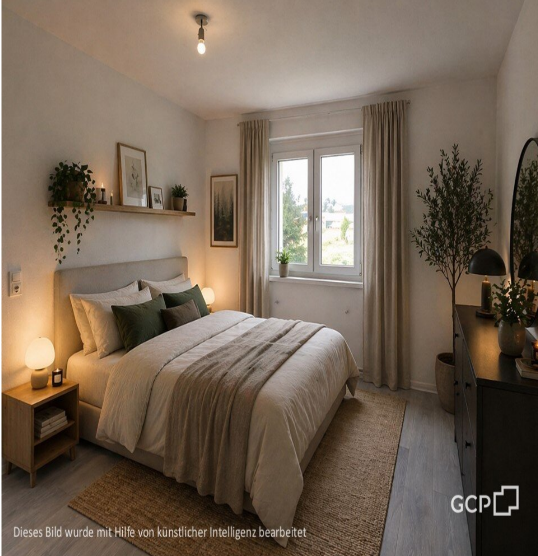
Dieses Bild wurde mit Hilfe von künstlicher Intelligenz bearbeitet